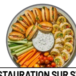
RESTAURATION SUR STAND