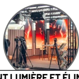
PONT LUMIÈRE ET ÉLINGUE